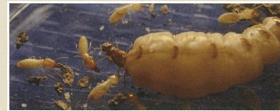
イエシロアリ(女王、働きアリ、兵隊アリ)

日本で建築物に大きな被害を与えるのはイエシロアリとヤマトシロアリの2種類です。前者は6月~7月の夕方頃に、後者はゴールデンウィーク前後の日中に羽アリが群飛します。これらのシロアリは湿気を好むため、浴室、台所、洗面所の土台、敷居、床組などあるいは雨漏りのある所が被害をよく受けます。さらにイエシロアリは巨大なコロニーを造ることができるので屋根裏まで被害が広がることがあります。