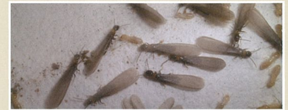
ヤマトシロアリ(羽アリ、働きアリ、兵隊アリ)